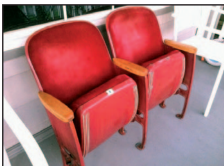
Zitjes in de diverse raden staan helaas vaak hoog op de agenda van de gemeenteraad.

Eerst halen we echter de punten aan die het grootste deel van de agenda uitmaakten. Telkens opnieuw werden belastingverlengingen ter stemming voorgelegd en het verdelen van 'postjes' was niet mooi om aan te zien. Hiermee bedoelen wij dat de meer-