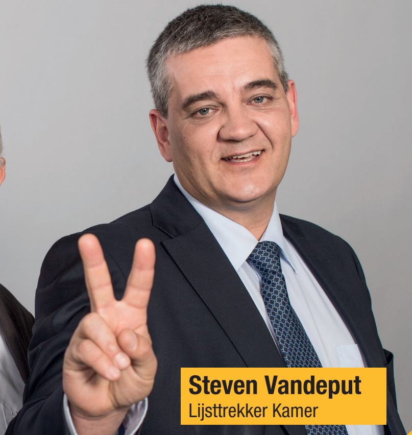
Steven Vandeput Lijsttrekker Kamer

Politici zijn er voor de burgers, de verenigingen, de ondernemingen, en niet omgekeerd. Politici moeten zuinig en doeltreffend omspringen met de beschikbare overheidsmiddelen, met uw geld.