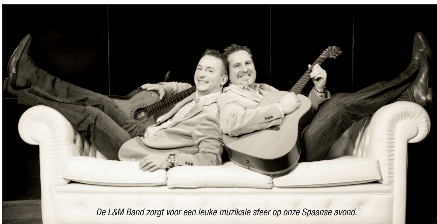
De L&M Band zorgt voor een leuke muzikale sfeer op onze Spaanse avond.