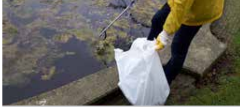
Houd Wellen mee proper! p.2