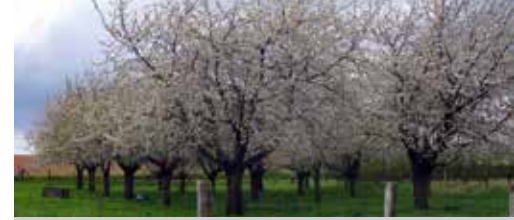
Hoogstamboomgaarden beschermd p.3